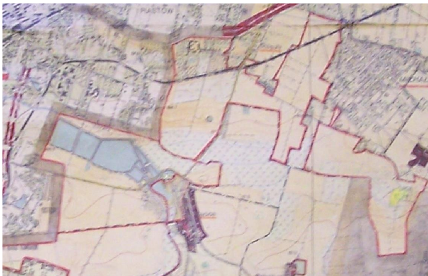
PLAN ZAGOSPODAROWANIA PRZESTRZENNEGO Gm. MICHAŁOWICE, 1973 r.

Uchwalony w 2002 roku Miejskowy plan Zagospodarowania Przestrzennego diametralnie odwrócił sytuację – przewidywał intensywny rozwój, ze zwartą zabudową kwartałów w rejonie dzisiejszego budynku Urzędu Gminy i rozległymi obszarami zabudowy mieszkaniowej.