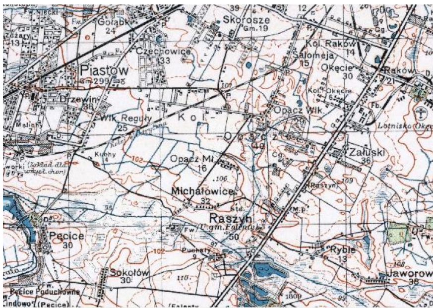
WARSZAWA POŁUDNIE, Wojskowy Instytut Geograficzny, 1932 r. – fragment mapy

Jeszcze w latach 70-tych XX wieku niemal cały teren Reguły po południowej stronie WKD, aż do zespołu pałacowo-parkowego Pęcice, przeznaczony był do zachowania jako tereny upraw i zieleni w dolinie rzeki Raszynki.